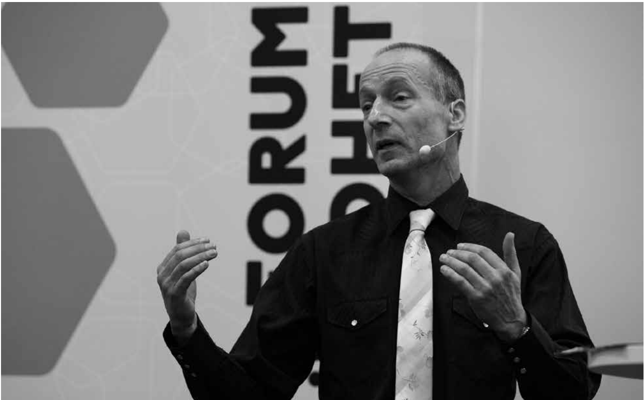
Jämställdhetsmyndigheten var aktiva på Forum jämställdhet i februari 2020.

de jämställdhetspolitiska delmålen, där jämställd hälsa och mäns våld mot kvinnor skiljer ut sig som prioriterade områden. Att satsningar inom dessa områden dels är finansierade, dels är grundade i tydliga problembeskrivningar samt involverar en bredd av aktörer under flera år, har bidragit till omfattande utvecklingsarbeten. Satsningarna på förlossningsvården och kvinnors hälsa visar, inte bara resultat, utan även effekter i form av minskade förlossningsskador och bättre vård av endometrios och andra tidigare underpri-