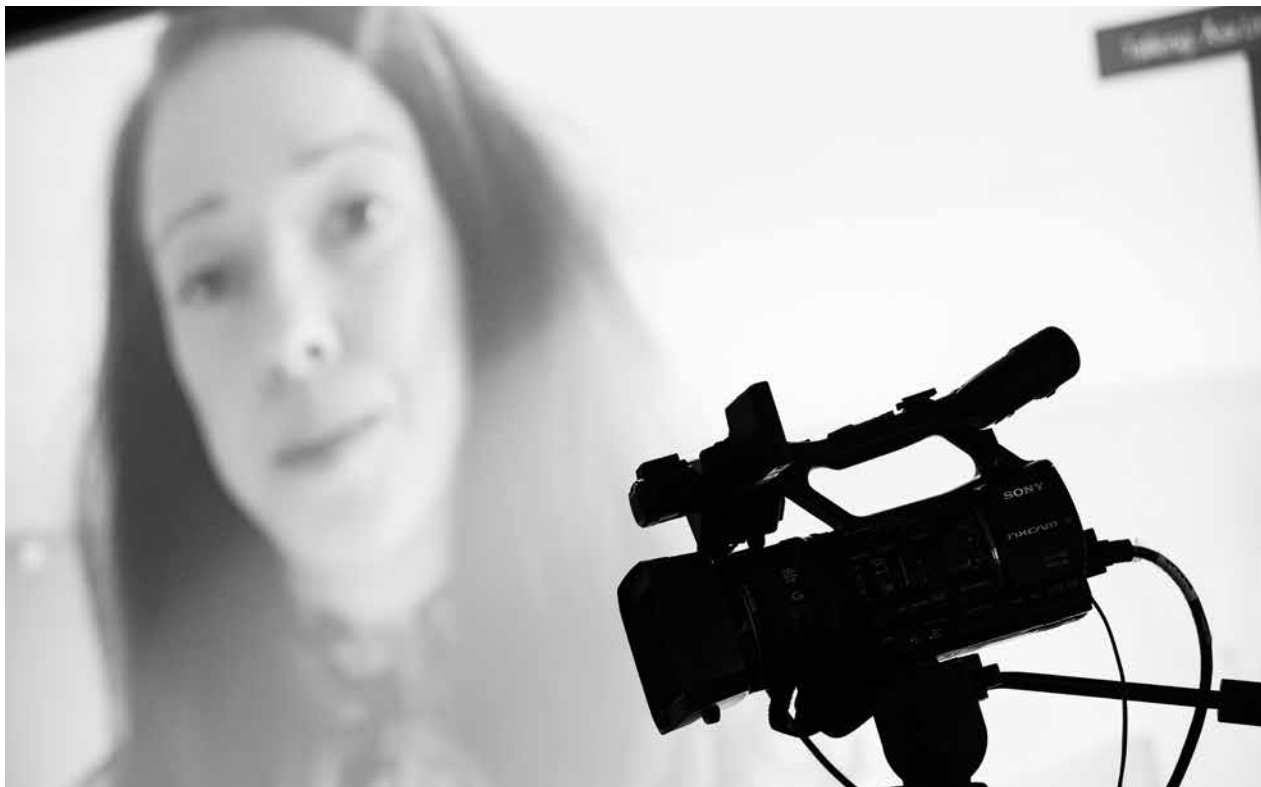
Dåvarande jämställdhetsminister Åsa Lindhagen deltog digitalt i ett av myndighetens arrangemang.

vanta jämställdhetsproblem som de själva identifierat för att uppnå resultat i sin verksamhet.